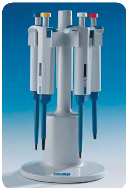
Штатив карусель для 5-ти дозаторов