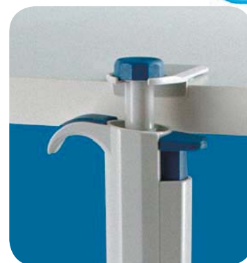
Удобный держатель, прилагается к каждому дозатору