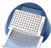
Система Ergomate см. стр. 33

Сброс фильтра одним нажатием большого пальца